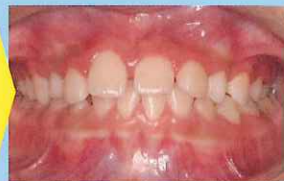
8才男児。前歯部交叉咬合。クワドヘリックスにより約2か月で改善