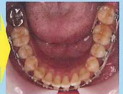
成人女性。左下8番を7番欠損部へ近心移動