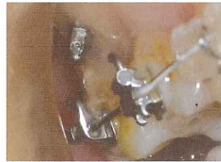
アブソアンカーならではの斜め打ち